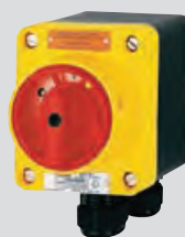
3-контактный аварийный выключатель