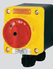
3-контактный аварийный выключатель